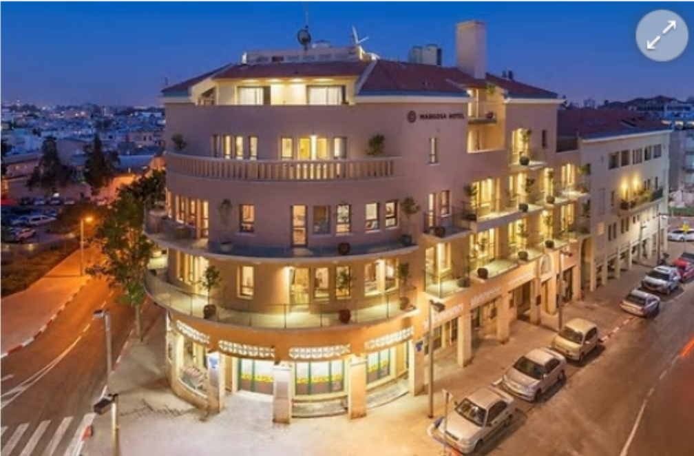
מלון מרגוזה ביפו. השקעה של 12 מיליון שקל

אוהבים מחשבים וטכנולוגיה? בואו להפוך את התשוקה למקצוע, בואו להיות מהנדסי תוכנה! עזראלי מכללה להנדסה