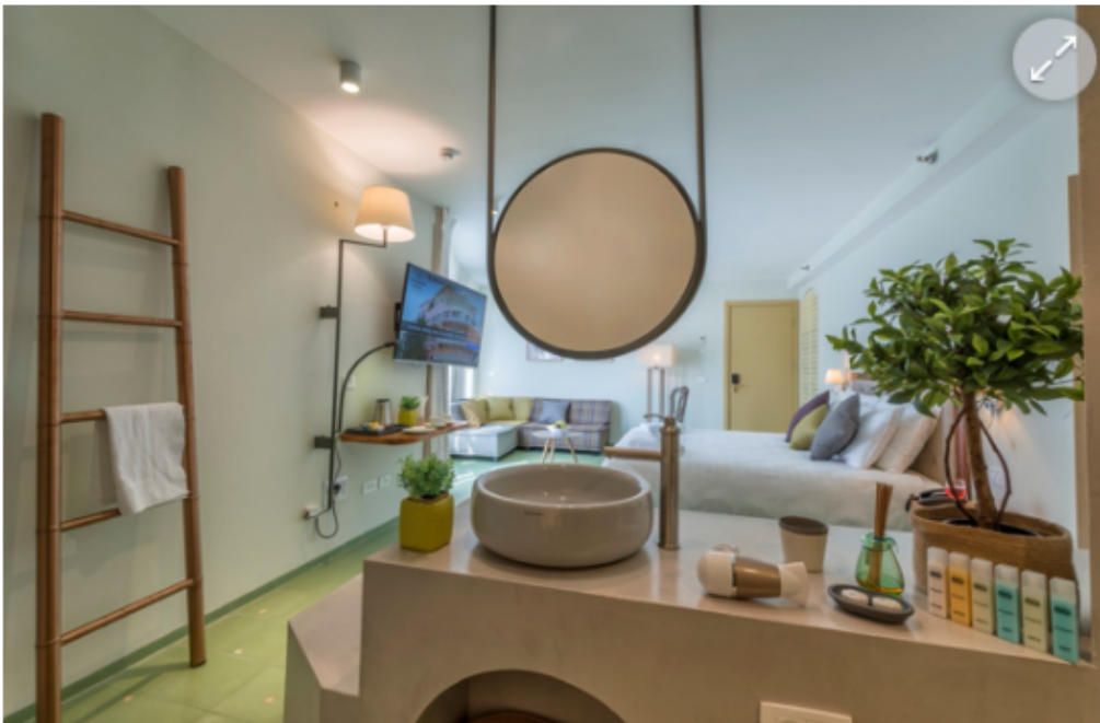
הצצה לחדרים

שדיררים פוטנציאליים החלו לחפש דירות קטנות יותר. "לכן כשהתקבלה ההצעה מהעירייה הבנו שזה הדבר הנכון לעשות", הוא מסביר את ההחלטה.